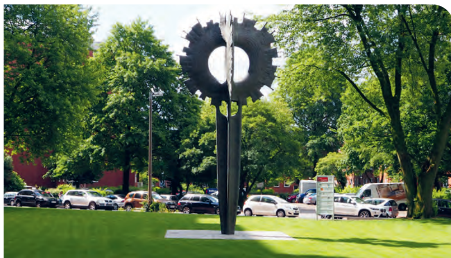
Skulptur auf dem Sonnenplatz