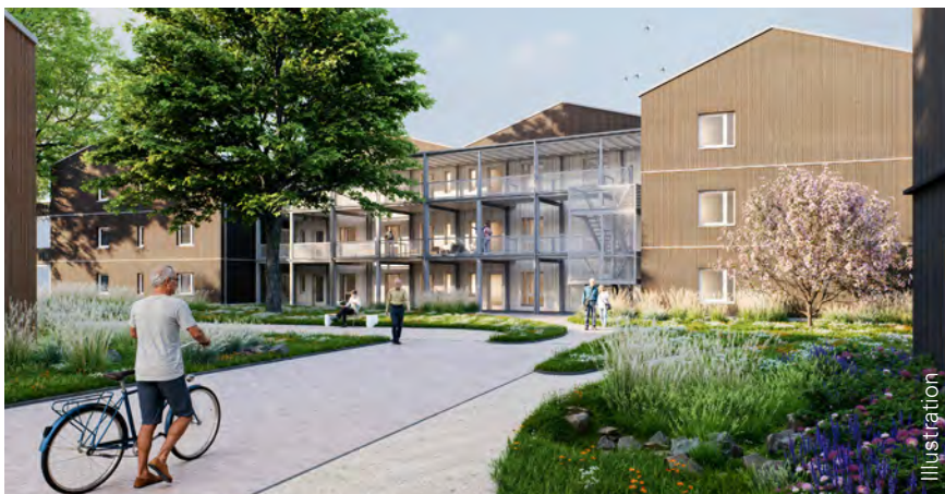
Innenhof des Gebäudes mit Ahornbaum und Laubengang

Dabei dient der Laubengang nicht nur als Zugang, sondern ist bewusst als Kommunikationsraum gestaltet: ein Ort, an dem man sich begegnet, ins Gespräch kommt, kurz oder auch lang verweilt. Von hier aus öffnet sich der Blick in den Innenhof mit einem beeindruckenden Ahorn im Zentrum, dessen ausladende Krone im Sommer wohlthuenden Schatten spendet und für ein angenehmes Klima sorgt. Direkt darunter entstehen eine Kinderspielfläche sowie Sitzmöglichkeiten, die dem Ort Leben einhauchen und Aufenthaltsqualität schaffen. So wird der Laubengang zu einem lebendigen Treffpunkt, der Gemeinschaft fördert und das Wohnumfeld auf besondere Weise bereichert.