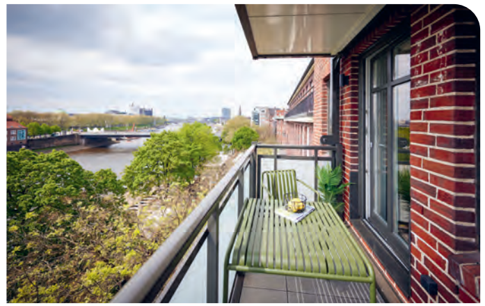
Ein Blick aus dem Apartment der Schlachte 22