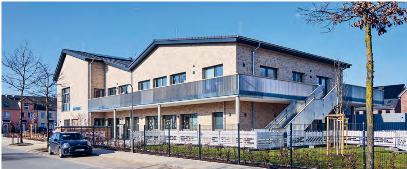
Der Neubau der Kita in der Carl-Katz-Straße

80 Plätze. »Insgesamt hat sich die Situation in den Kitas etwas entspannt – wie viele andere Bundesländer sehen auch wir Entlastung bei den Betreuungsplätzen. Gleichzeitig gibt es weiterhin große regionale Unterschiede, und genau deshalb freut es mich sehr, dass wir mit der neuen Einrichtung die Versorgungslage im Stadtteil Obervieland dauerhaft verbessern können. Das ist ein echter Gewinn für die Familien im Quartier«, so der Senator für Kinder und Bildung, Mark Rackles.