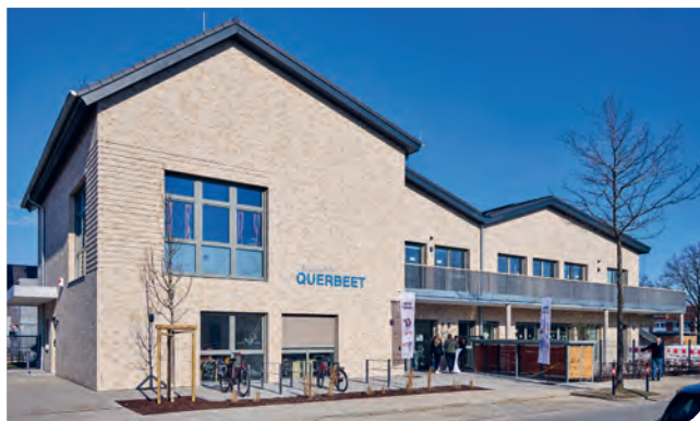
Vorderseite des Neubaus der Kita