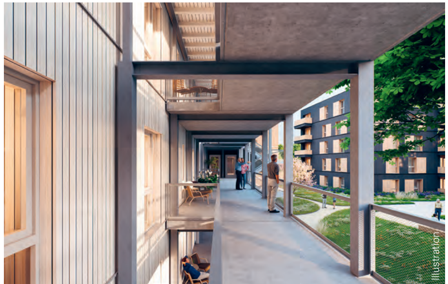
Laubengang des dreigeschossigen Gebäudes

Rund ein Jahr nach dem offiziellen Startschuss für den Bau der beiden fünfgeschossigen Wohngebäude mit jeweils 18 geförderten Wohnungen ist im Ellener Hof deutlich sichtbar, wie schnell das Quartier wächst. Die Gebäude entstehen zeitversetzt, und das zuerst begonnene Haus zeigt die Fortschritte besonders gut. Die Hülle ist geschlossen und im Inneren herrscht reger Betrieb: Leitungen werden verlegt, die Bäder vorbereitet und die Räume Schritt für Schritt ausgebaut. Auch die Balkone nehmen Gestalt an – ihre Vormontage läuft bereits auf Hochtouren. Gleichzeitig erhält die Fassade ihre Holzverkleidung, die den Häusern später einen natürlichen Charakter verleiht. »Durch das Winterwetter liegen wir ein wenig hinter dem ursprünglichen Zeitplan, aber ich bin zuversichtlich, dass wir voraussichtlich Ende des dritten Quartals mit der Vermietung starten können«, sagt Sidney Cline-Thomas, Prokurist und Abteilungsleiter Bestandsverwaltung und verantwortlich für die Vermietung. In unmittelbarer Nachbarschaft wächst das zweite, baugleiche Gebäude heran.