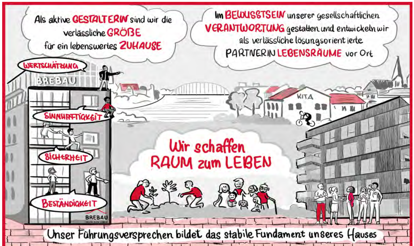
Die Visualisierung des Leitbildes der BREBAU

Für unsere Mieter:innen bedeutet das: Sie können sich auf ein Unternehmen verlassen, das seinen Auftrag ernst nimmt, das zuhört, das verlässlich handelt und Wohnräume schafft, die Menschen verbinden, die Sicherheit geben und auch für kommende Generationen Bestand haben. Unser Leitbild ist damit nicht nur ein internes Orientierungssystem, sondern ein Versprechen an alle, die mit uns leben und dafür arbeiten, unseren Mieter:innen ein lebenswertes Zuhause zu ermöglichen.