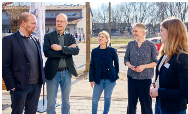
Ein freundlicher Empfang bei schönem Wetter