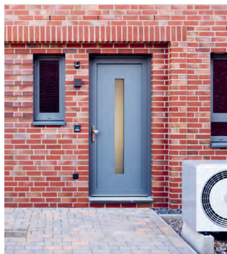
Oben: Ein Eingangsbereich mit Wärmepumpe