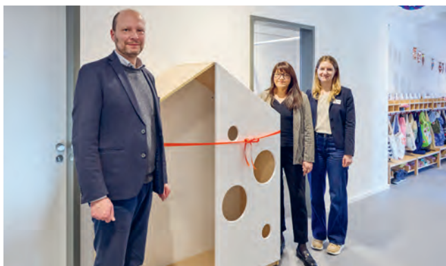
Übergabe des Geschenks von der BREBAU