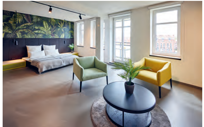
Der Schlaf- und Wohnbereich des Apartments