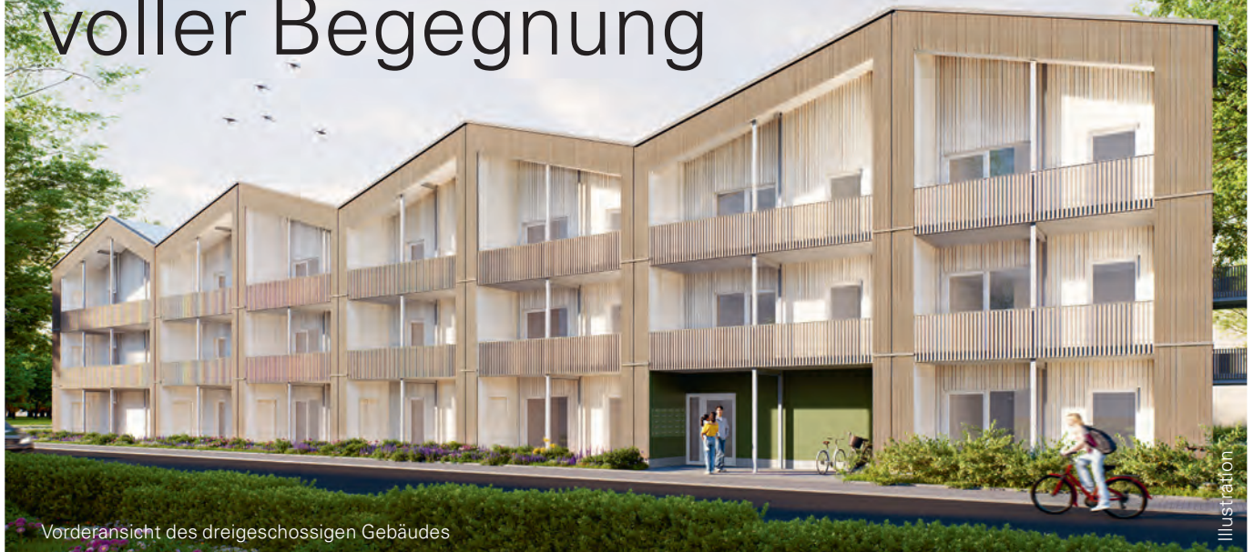
Vorderansicht des dreigeschossigen Gebäudes