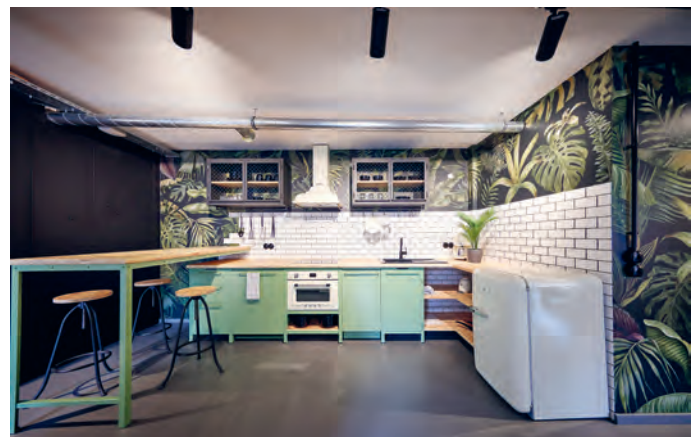
Der Gemeinschaftsbereich der Einzelzimmer