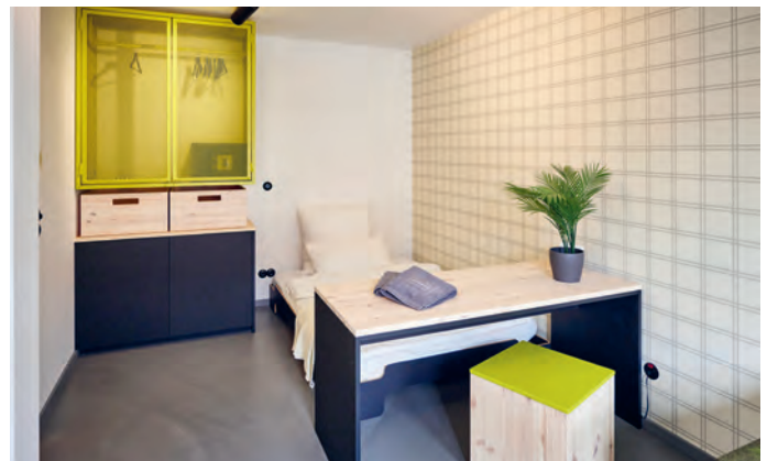
Ein Beispiel für ein Einzelzimmer der Schlachte 22