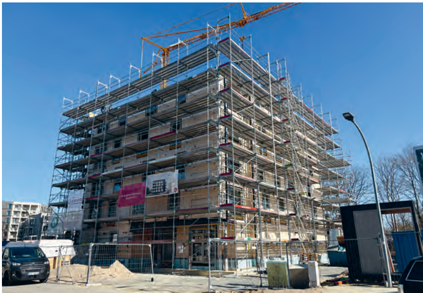
Eines der fünfgeschossigen Gebäude im Ellener Hof