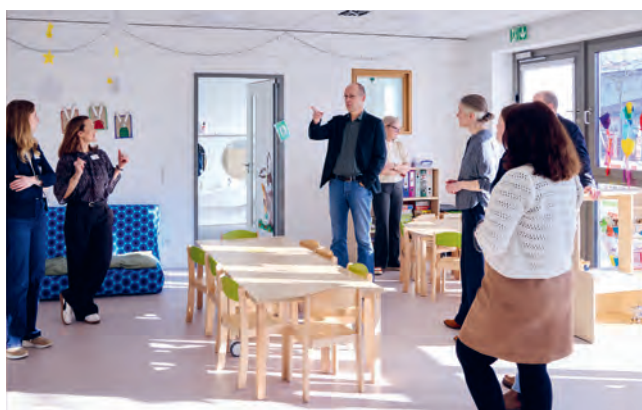
Gruppenraum in der Kita

Ein schöner Moment war die Übergabe des Einweihungsgeschenks der BREBAU: ein Holzhaus, das künftig nicht nur als ruhiger Rückzugsort im Kita-Alltag dienen soll, sondern auch als lebendiger Ort zum Spielen.