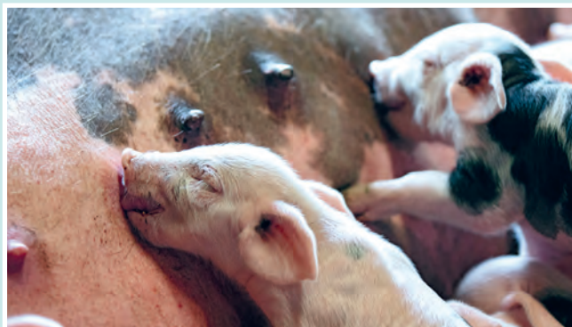
Im Tiergehege des Bürgerparks leben die Bunten Bentheimer Schweine

Der Frühling ist da und mit ihm erwacht auch die Tier- und Pflanzenwelt aus ihrem Winterschlaf: die perfekte Zeit, draußen zu spielen und die Natur zu entdecken. Wir geben dir Tipps für kostenlose Ausflüge in Bremen.