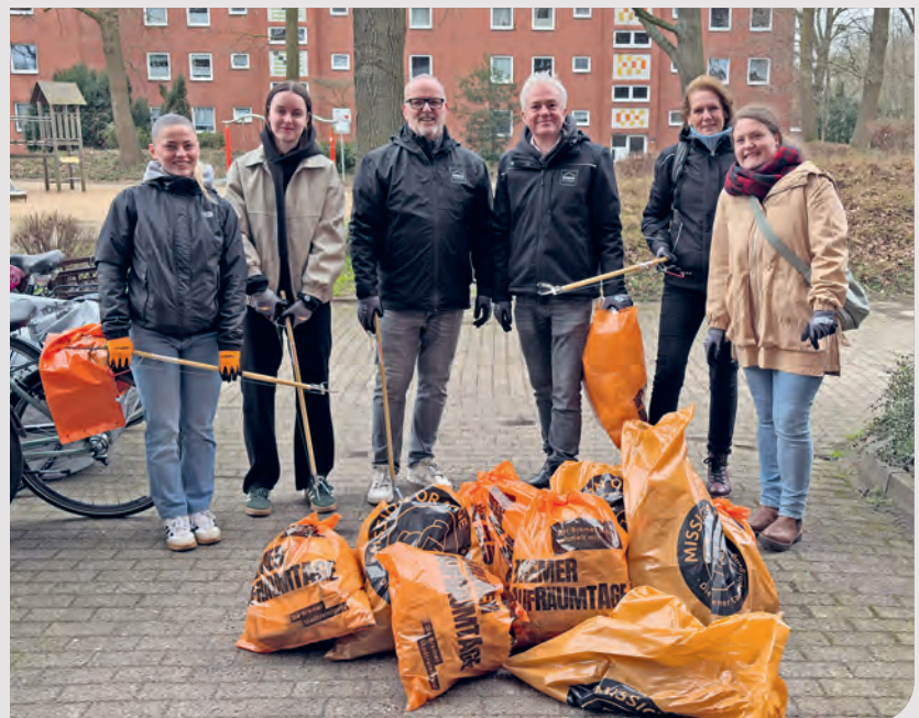
Mitarbeitende der BREBAU sammelten Müll u.a.im Bestand in Arsten

Im letzten Jahr haben wir uns gezielt an Mieter:innen gewandt. Jetzt waren wir dran und sind mit gutem Beispiel voran gegangen! Der Einsatz hat sich gleich doppelt gelohnt: Unsere Mitarbeitenden verbesserten nicht nur die Sauberkeit in den Quartieren, sondern haben auch ihren Teamgeist gestärkt. Das gemeinsame Engagement zeigte deutlich, dass wir Verantwortung übernehmen und unsere Werte aktiv leben.