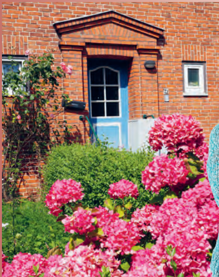
Eine Haustür auf dem Beginenlande bei schönem Wetter